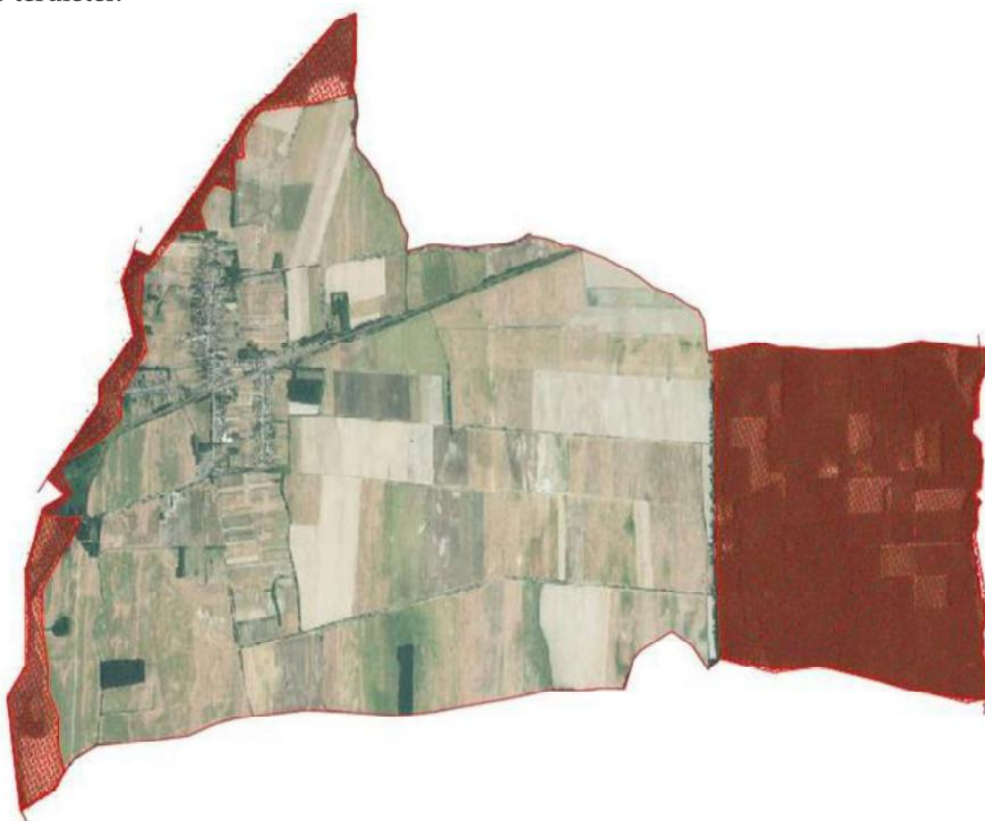
Ökológiai folyosó területei