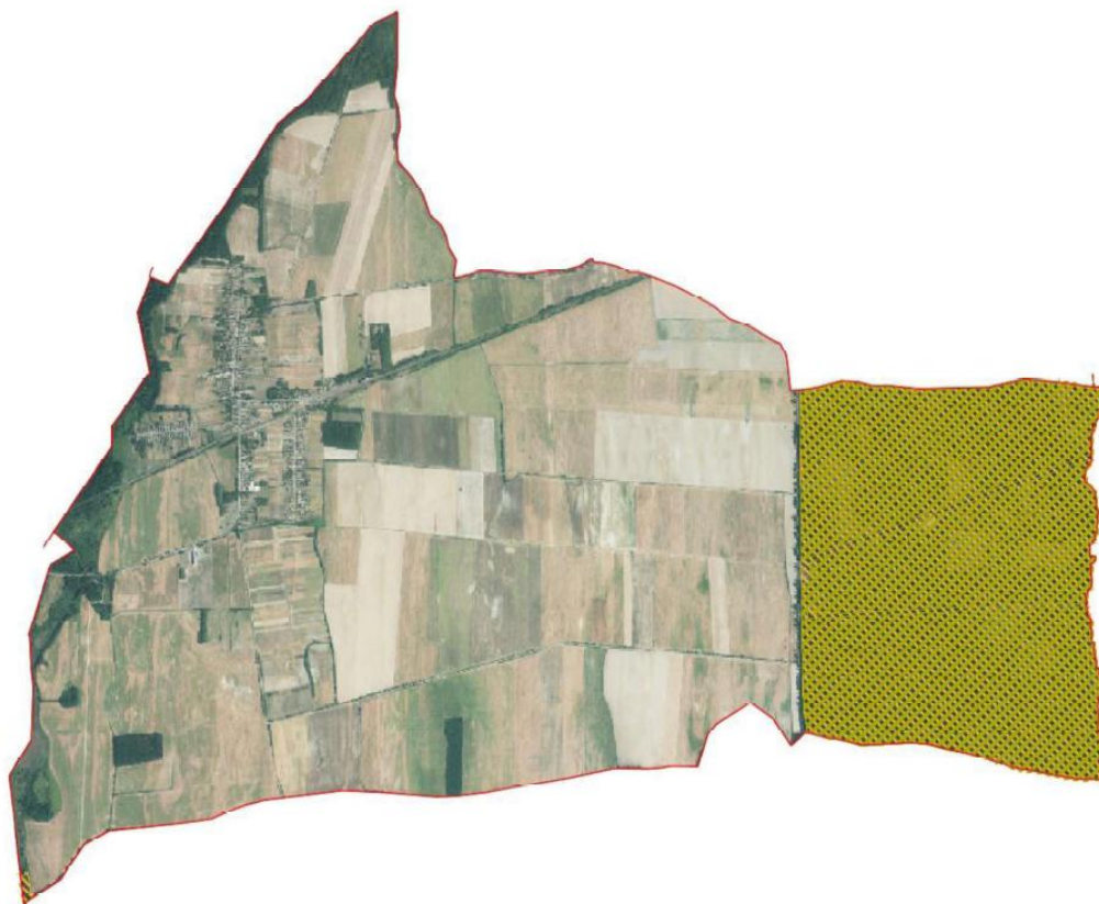
Natura 2000 területek